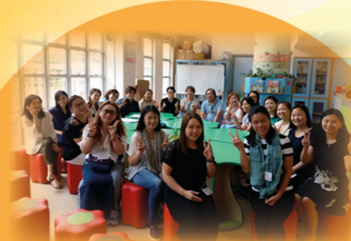
閱讀大使伴身旁，樂在世德齊「悅」讀！

上年度的閱讀主題是以四個品德素養和成長必需的養分為核心——「正向思考」、「尊重與關懷」、「掌握情緒」和「環境保護」。透過故事活動，培育學生建立良好的品格素養。「家長閱讀大使」主持《故事fun享》活動，內容包括暖身活動、講故事環節、故事延伸活動、深層閱讀討論、生活情境探討等；與學生的活動完結後，「家長閱讀大使」會即時進行檢討會，討論活動成效，務求同心合力，力臻完善，共建「悅」讀氛圍。