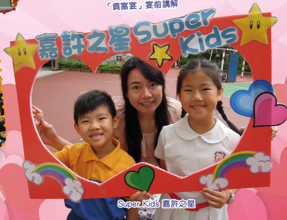
Super Kids 嘉許之星