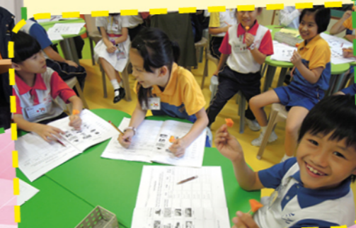
Food tasting activity in the English lesson.