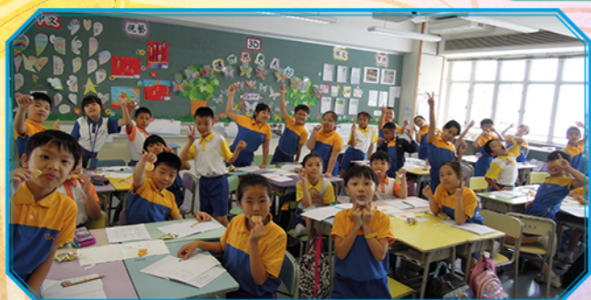
老師教導同學「五感」，讓其親自體驗寫出食物的味道。