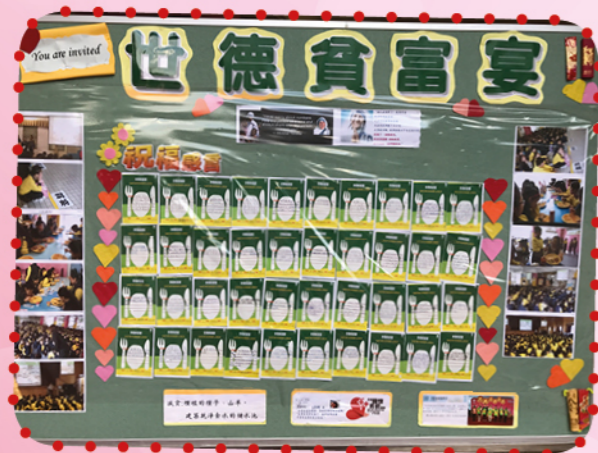
「貧富宴」學生心聲留言