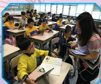
學生採用iPad搜集資料，用於寫作課題，令寫作內容更豐富。