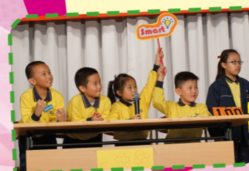
English Quiz Show 2017