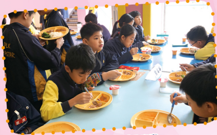
孩子們正在品嚐「貧富宴」

為配合學校年度主題——「讓世界更美好」，我們特別為高年級同學舉辦了一次「貧富宴」，讓學生體驗吃不飽的滋味。同學們不但沒有埋怨，而且更學懂了慷慨施予，惜福感恩。我們也邀請了「街坊小子木偶劇場」到校演出，讓學生在開放的場景下認識弱能人士的需要，從而學習接納與關懷有需要的人。此外，老師們為同學舉辦各項關懷活動如：「嘉許印溫情茶聚」、「手作感恩玫瑰敬母親」、「義工送湯探訪獨居長者」等，讓他們從小在關愛的環境下，學習關懷身邊的人，齊讓世界更美好！