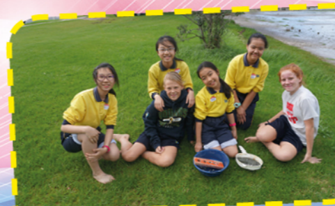
New Zealand Study Tour - Field trip with buddies