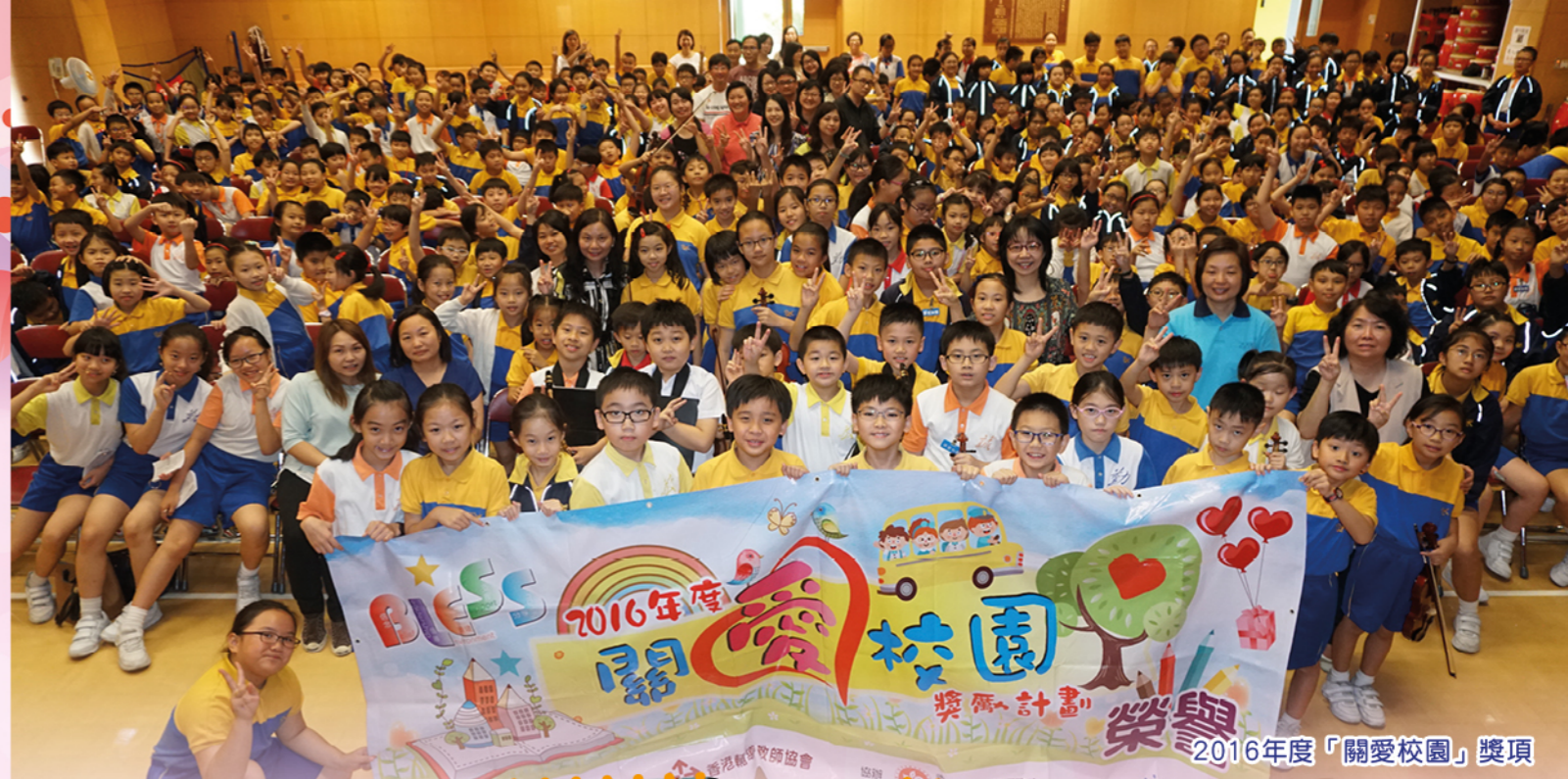
2016年度「關愛校園」獎項