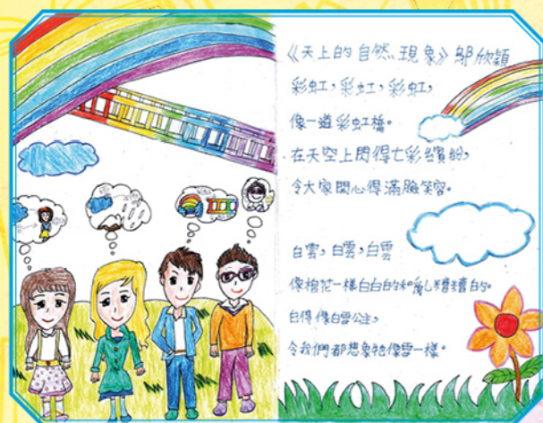
來欣賞我們的作品