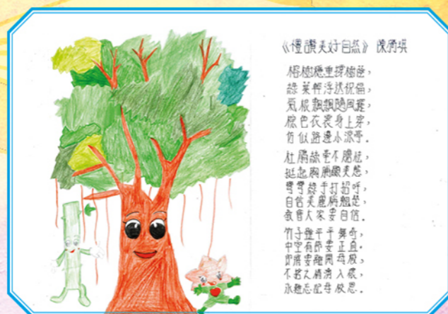
讓同學們親自體會及發掘自己身邊美麗的事物，他們會發現原來這個世界是如此美好的。