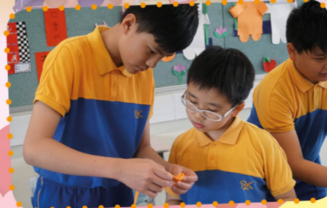
手作感恩玫瑰敬母親