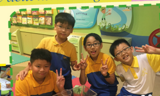
Learning Journey at Noah's Ark - Future World