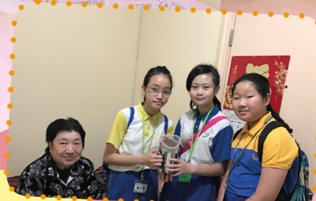
義工送湯探訪獨居長者