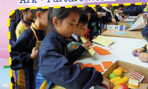
Students enjoying English activities during recesses