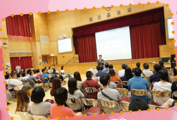
「正向教育」小一家長會