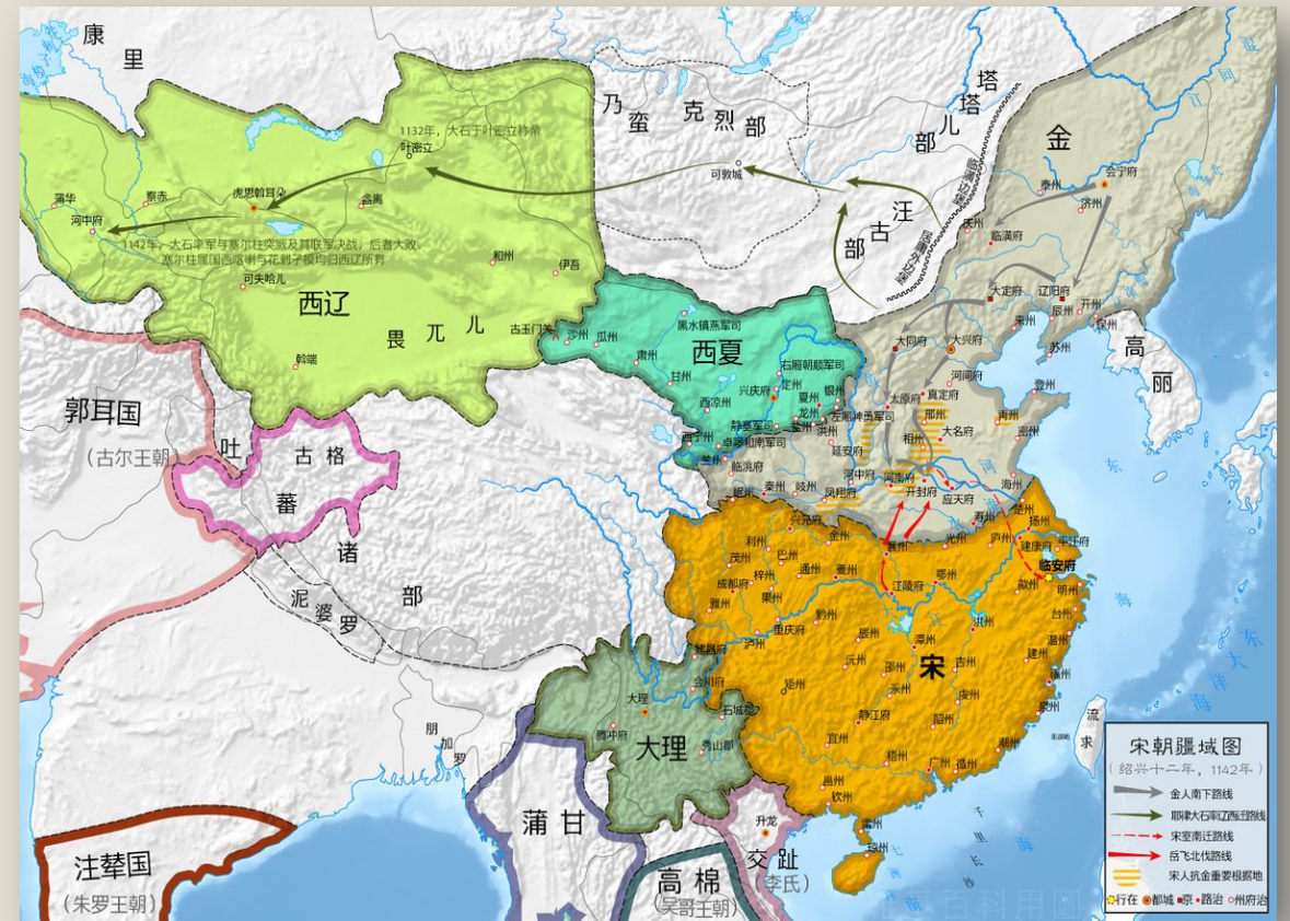
南宋政府同時面對金、西夏及蒙元的威脅。