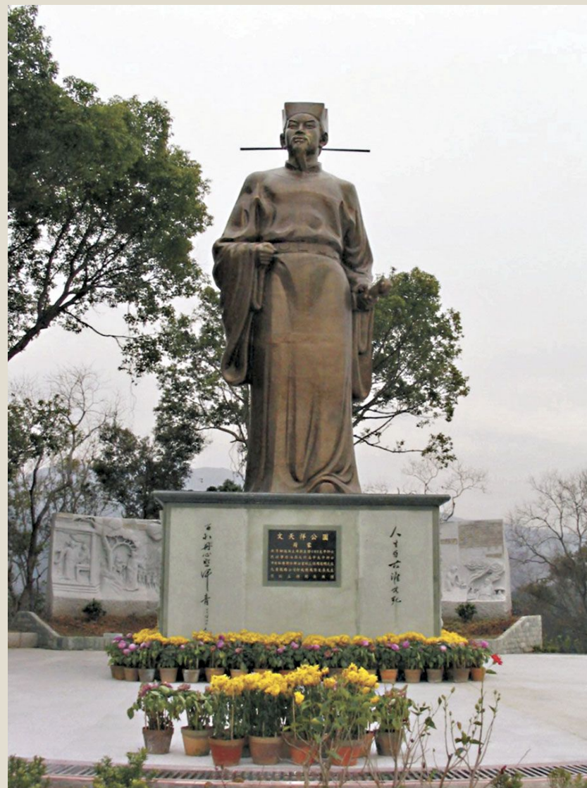
新田文天祥公園的文天祥像